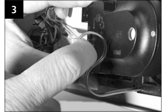
3 Sprechanlage hinter die Befestigungsbügel klemmen.