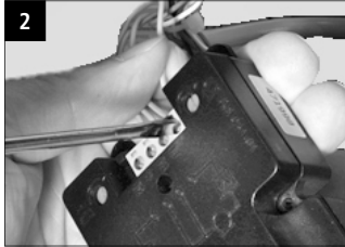
2 Sprechanlage anschließen.